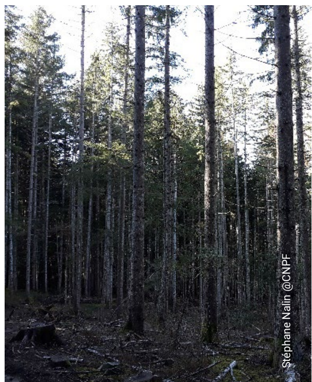
Stéphane Nalin @CNPf