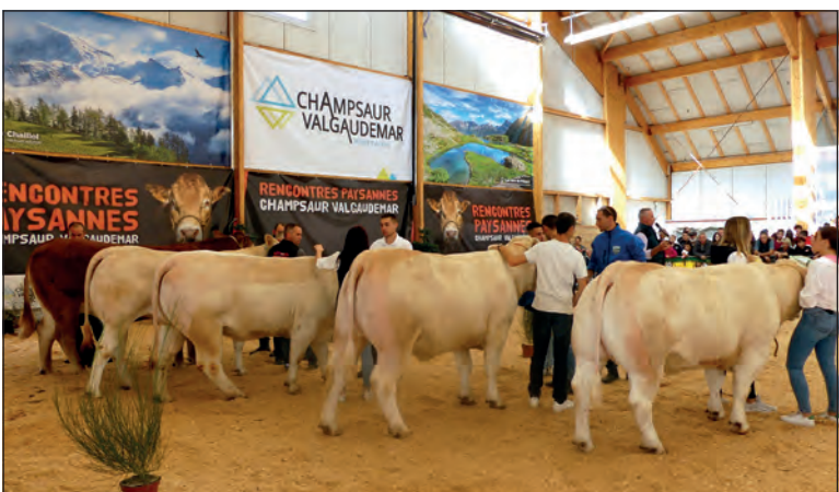
La première vente aux enchères des Excellentes s'est déroulée aux Rencontres paysannes du Champsaur-Valgaudemar en 2022.